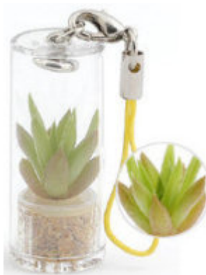
Handyblume: Ausgefallenes Accessoir fürs Handy.

Diese Miniatur-Pflanzen, denen ein 40 x 17 Millimeter großer Schlüsselanhänger genug Lebensraum bietet, brauchen nur wenig Pflege: Es reicht, die Kapsel alle ein bis zwei Wochen kurz ins Wasser zu tauchen. Zusätzlich sollten Handy-Gärtner das Handy ab und an auf dem Tisch liegen lassen, damit die kleinen Pflänzchen genug Licht bekommen.